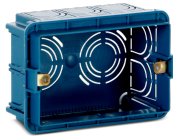
SCI503 Codice 22461